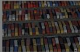
美国加利福尼亚州长滩的书架箱。美国的经常账户在接近GDP的6%。(摄影: David McNew/Getty)。