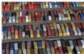
美国加利福尼亚州长滩的集款箱。美国的经常账户在达到GDP的6%。