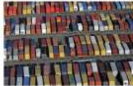
美国加利福尼亚州长滩的集装箱。美国的经常账户在超过GDP的6%。(摄影: David McNew/Getty)。