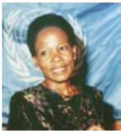
联合国副秘书长、 联合国人居署 执行主任 安娜·蒂贝琼卡

城市是人类一半人口的家园。城市在提供众多机遇的同时，也是人们遭受痛苦的地方。随着贫民窟和贫困住区与广大舒适安逸的、富裕的地区共同存在，我们在城市中经常看到富人与穷人之间、得益于城市化发展的群体与在城市化过程中边缘化的群体之间存在的巨大差距。世界领导人在同意签署千年发展目标时作出承诺，致力于在 2020 年之前改善至少一亿贫民窟人口的生活。实现这一目标将意味着应对世界上一些最为严峻的社会、经济与环境上的挑战。作为联合国人居署成立的 30 周年纪念，今年即将举办的世界城市论坛极为适宜推动与激励这一进程。我们的目标或许是全球性的，但是只有通过地方上的行动才能得以最为有效地实现。我敦促所有与会人员一起努力，尽他们最大的力量开创一个真正的可持续城市发展的新时代。