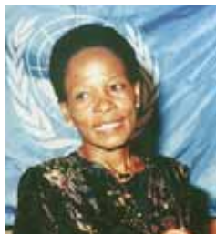
Anna Tibaijuka Secretaria General Adjunta de las Naciones Unidas y Directora Ejecutiva de UN-HABITAT

Al adoptar los Objetivos de Desarrollo del Milenio, líderes mundiales se comprometieron a mejorar la vida de por lo menos 100 millones de personas que viven en asentamientos precarios para el año 2020. Alcanzar esta meta significará abordar uno de los desafíos mundiales más críticos desde el punto de vista social, económico y de medio ambiente. El Foro Urbano Mundial – que se celebrará este año en el cual UN-HABITAT cumple su 30 aniversario – es una buena ocasión para consolidar los avances logrados. Nuestros objetivos pueden ser globales, pero ellos serán alcanzados de una forma más efectiva a través de acciones locales. Hago un llamamiento a todos los participantes para que trabajen juntos y den lo mejor de ellos para entrar en una nueva y verdadera era de desarrollo urbano sostenible.