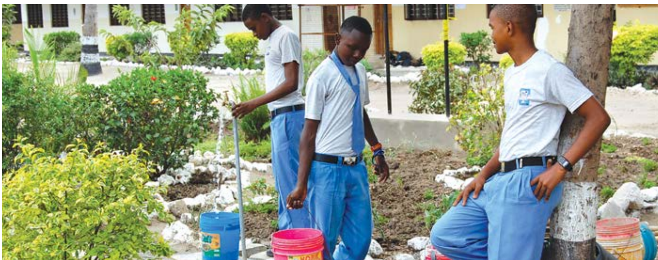
Upatikanaji wa maji hufanya mazingira ya shuleni yawe safi na mazuri ya kujifunzia.