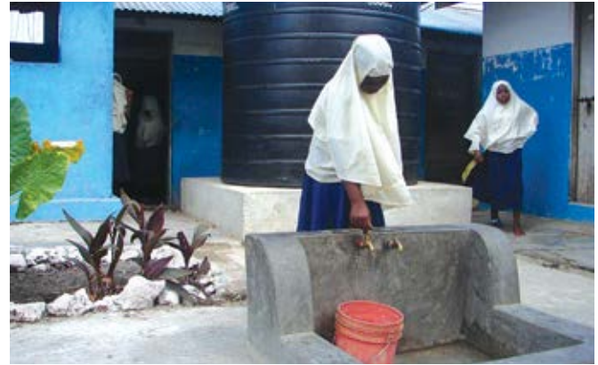
Wanafunzi wanafaidi upatikanaji wa maji masafi.

Tandale chakulabora ni makazi ya kipato cha chini yaliyoko katika kata ya Tandale katika mji wa Dar es Salaam. Makazi yapo katika kitongoji cha makazi mengine maarufu yasiyopangwa ya Manzese, yaliyo na wakazi wengi, ukosefu wa huduma za kijamii za kuaminika kama vile maji, usafi wa mazingirana na milipuko ya magonjwa. Hali ya kijamii na kiuchumi ya eneo hilo linapingana na maana ya jina lake ambalo lina maanisha “Chakula Bora”