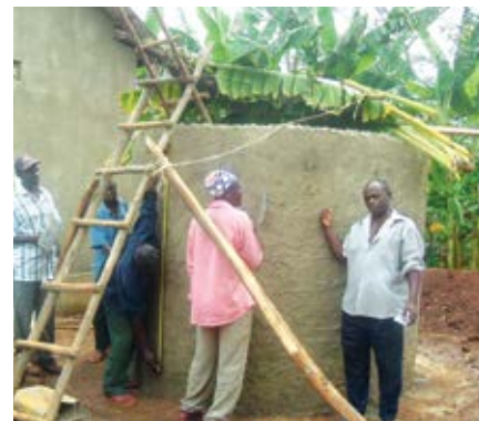
Ujenzi wa tanki la kuvuna maji ya mvua.

Kwa mujibu wa jamii husika matokeo ya mradi huu yamekwenda zaidi ya uboreshaji wa miundo mbinu. Yafuatayo ni matokeo yasiyo ya moja kwa moja ambayo yameto kana na utekelezaji wa mradi: