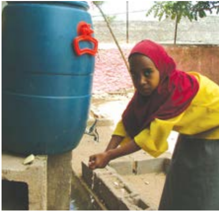
Kukuza usafi shuleni kwa kutumia vituo vya kunawia mikono.

la kuhifadhia maji lenye ujazo wa lita 5000 na vituo vya kushote maji ili kupunguza makali ya ukosefu wa maji. Mradi haukuwa na matawi katika jamii inayoizunguka shule na wala haukuwa na kipengele cha usafi wa mazingira. Mfumo huo ulileta migogoro mingi ya ki-uendeshaji na ki-usimamizi ambayo ilipelekea mradi kufa mwaka 2001. Baada ya hapo hapakuwa na juhudi zozote za makusudi za kuufufua mradi na kurudisha huduma kwa jamii ambayo ilikuwa inahitaji huduma.