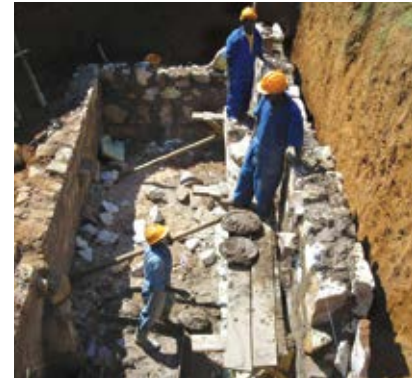
Ukarabati wa vyoo shuleni unaendelea.

cha familia za jamii nufaika, mfumo huu utaleta mapato mbadala mbali na mapato yatokanayo na mauzo na huduma za maji. Kulingana na uzoefu wa DAWASA moja ya vikwazo vikubwa katika kuendeleza miradi ya maji ya jamii ni mgawanyo wa fedha za mradi kwa ajili ya shughuli nyingine za jamii mbali na lengo la utekezaji na huduma la uendeshaji na usimamizi wa mradi (O&M). Hii inasababishwa na ukweli kwamba jamii hazina vyanzo mbadala vya mapato kuhudumia shughuli zingine za jamii na hivyo kutegemea mapato ya mradi pekee.