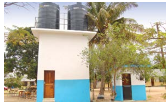
Nyumba mpya iliyojengwa ya kuhifadhi maji na vifaa.