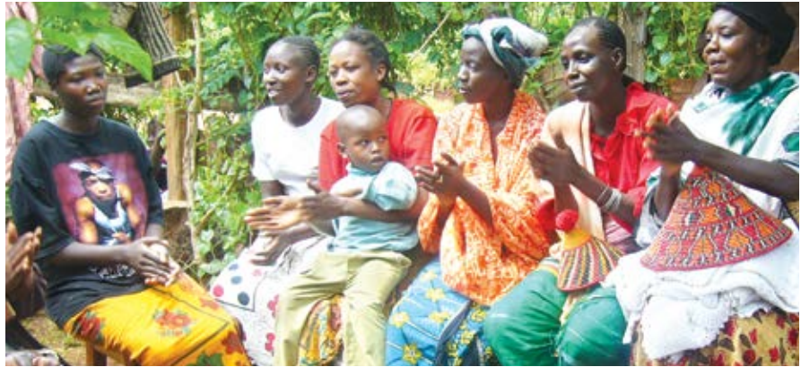
Mkutano wa mashauriano na wanawake juu ya mahitaji ya maji na usafi.

Kwasababu hiyo jamii ya Tandale Chakula Bora iliathiriwa vibaya ki ustawi wa jamii -