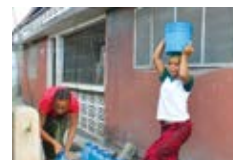
Wanajamii wakichota maji katika kioski nje ya eneo la shule

Shuhuda hizo mbili zinakazia umuhimu wa mradi katika kuboresha maisha ya shule na wakazi wa Tandale Uzuri kijamii na kiuchumi.